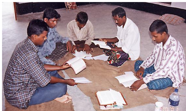
Ilosanomaoppaita eri kielillä